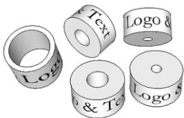
Gravur auf der Aussenseite (rundherum) Material: Edelstahl massiv glänzend-poliert